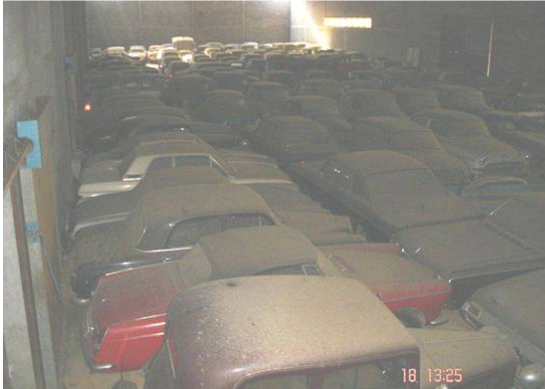
Un almacén lleno de automóviles clásicos!!!!