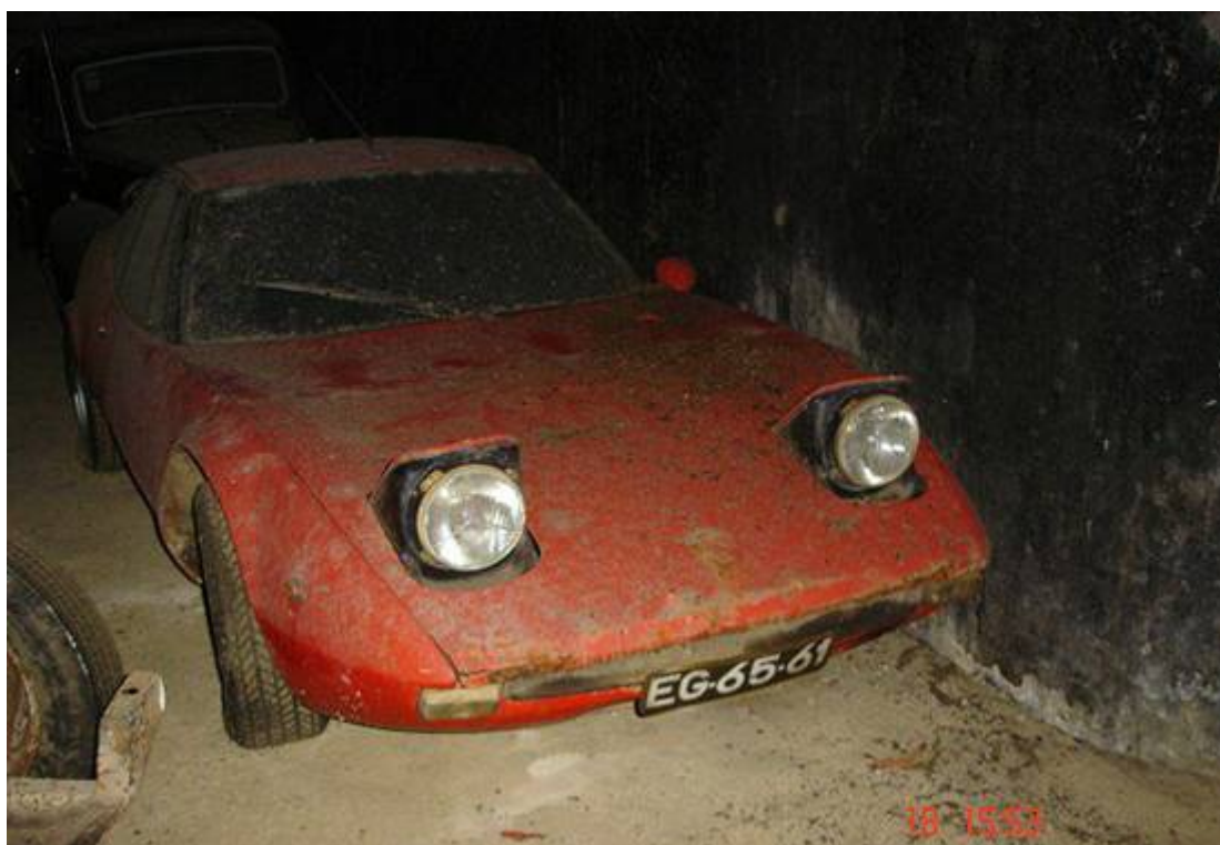
Abarth 1300 Scorpione