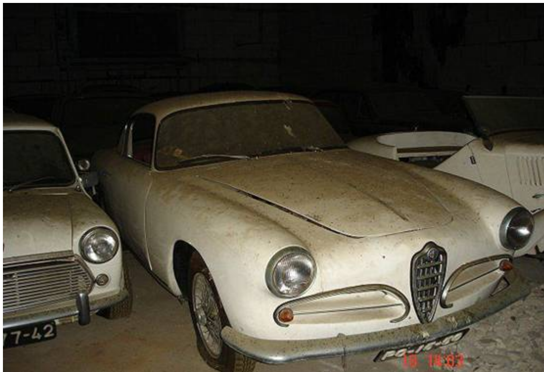
Mini, Alfa 1900 Super Sprint, Balilla.