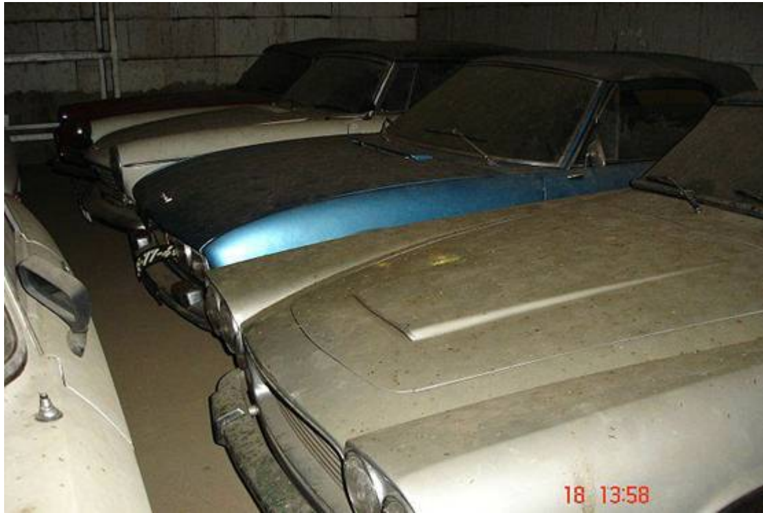
Lancia Flaminia Coupé, Peugeot 504 cabriolet & 404 cabriolet.