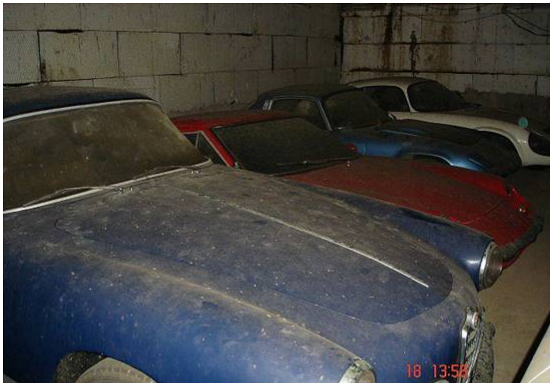
Alfa Giulietta, Lotus Europa, another Lotus Elan FHC, Matra Djet?