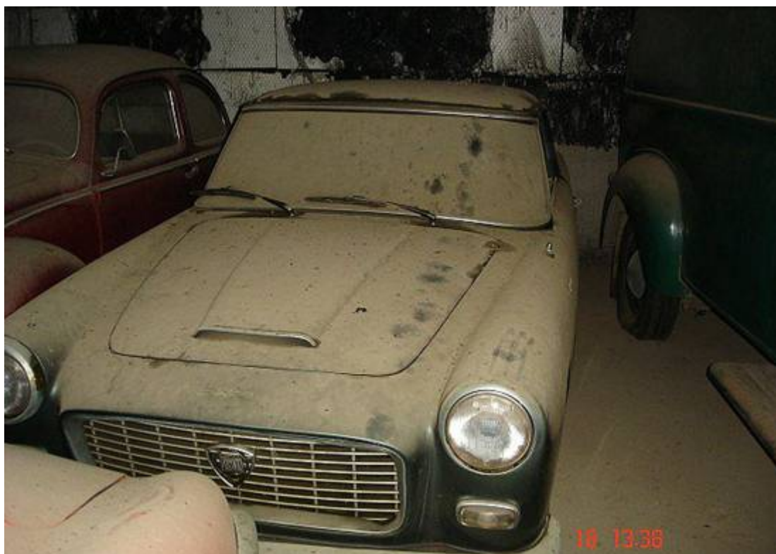
Lancia Flaminia Coupé