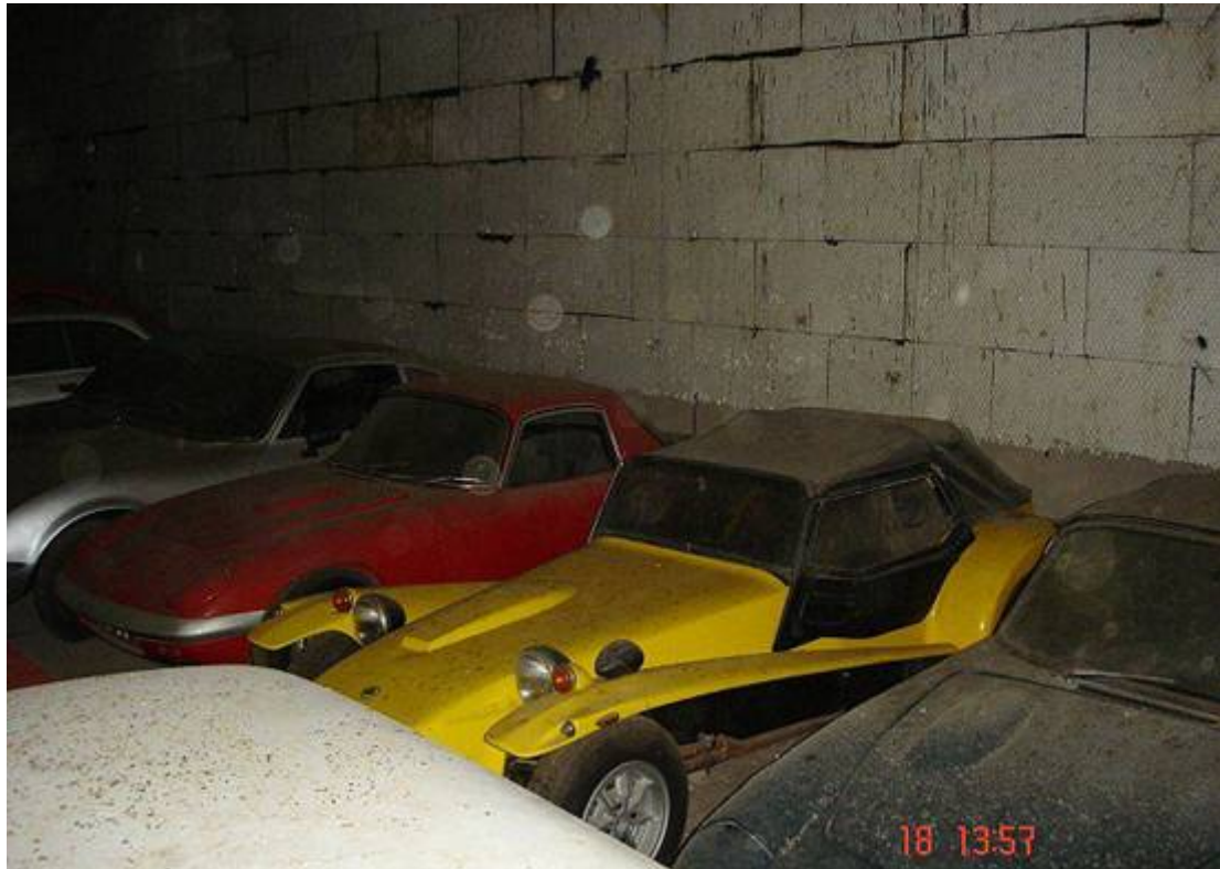
Opel GT, Lotus Elan FHC, Lotus Super Seven Series IV, Lotus Elan DHC.