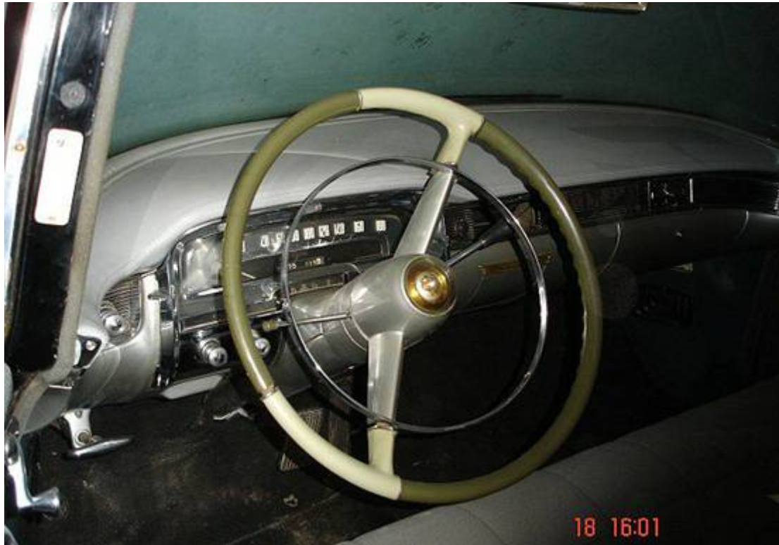
American (inspired) design