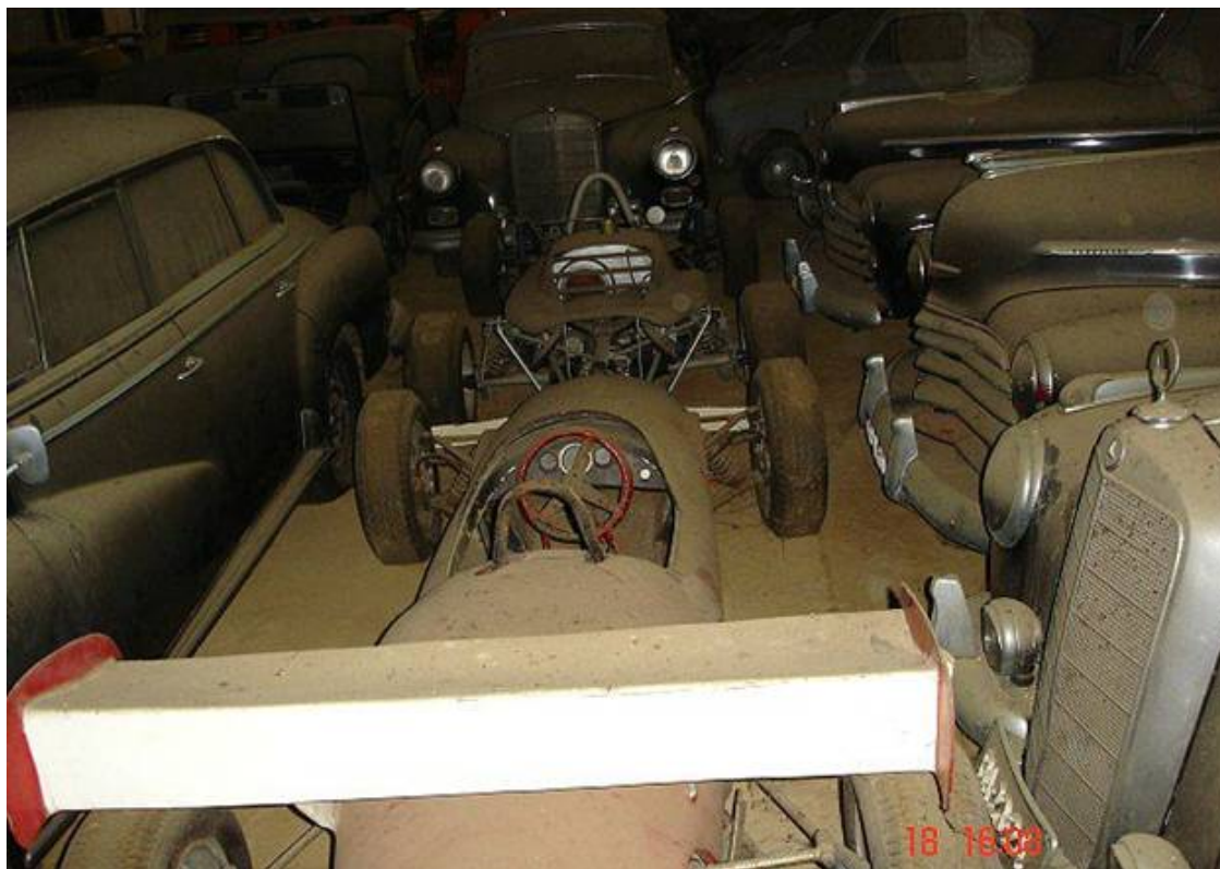
Formula racers, Chryslers, Mercedes, Austin A30.