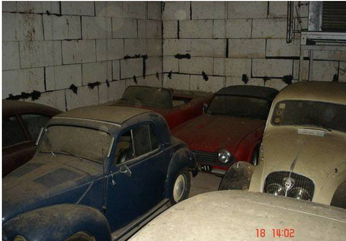
Fiat Topolino II, Triumph TR4, Peugeot 202.