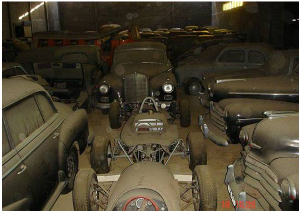
BMW V8, Formula racers, Chryslers, Mercedes, Austin A30.