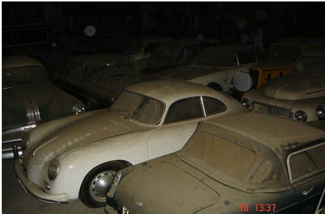
Porsche 356, Austin Healey Sprite MkII, Volvo PV 544, Ford Y?