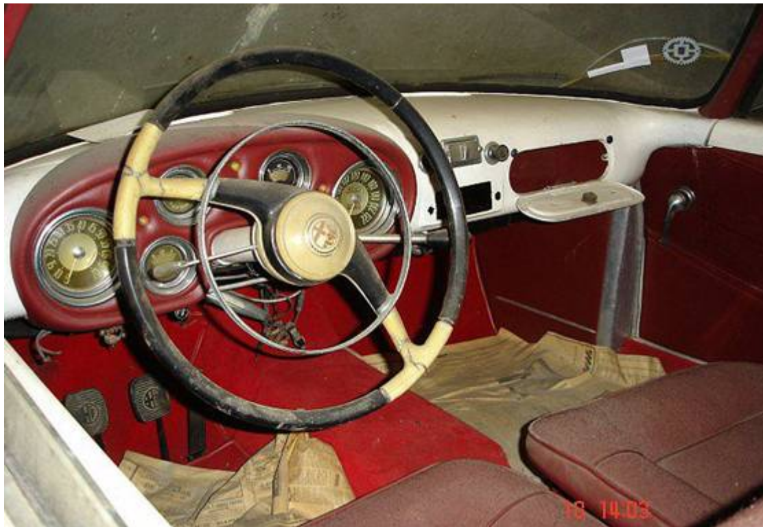
Interior de Alfa Romeo