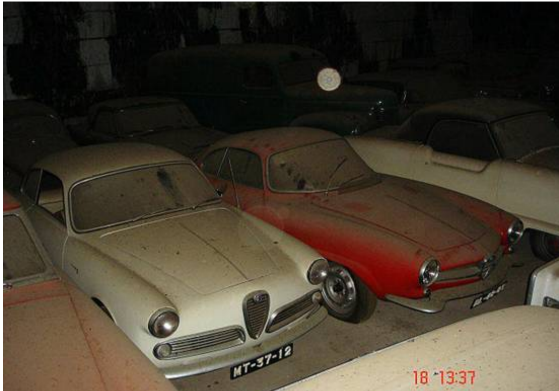
Giulietta Sprint, Giulia Sprint Speciale (SS), Nash Metropolitan.